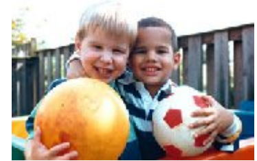
دید چشم سالم

بیماری است که در آن عدسی چشم کدر می شود. کدر شدن عدسی باعث کم شدن دید بیمار می شود.