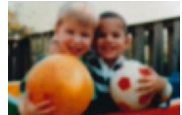
دید چشم کاتاراکتی

علت هایی که باعث کدر شدن عدسی می شوند، عبارتند از: ● بالا رفتن سن ● قرار گرفتن در معرض نور خورشید (و اشعه ماوراء بنفش) در طول زندگی، مثل: الف- کار در محوطه های باز و روی آب ب- زندگی در ارتفاعات زیاد